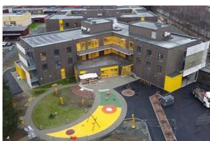
Verdal bo og behandlingssenter