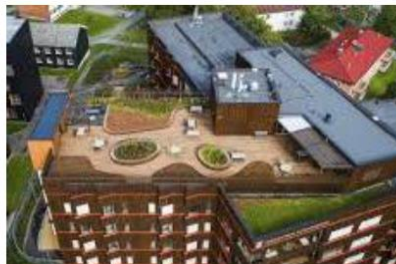
Persuanet helse og velferdssenter